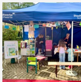
Kunst-Aktion für Groß und Klein mit der KIS auf dem Wuckenhof