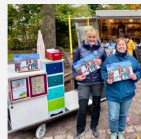
Für den guten Zweck mit den Lions-Frauen auf dem Wochenmarkt