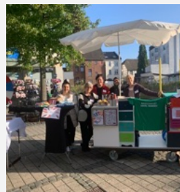
Gegen Rassismus mit dem Rat für Integration auf dem Cava-Platz